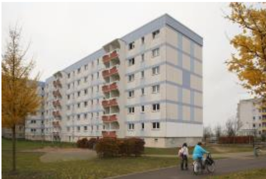
Ein Flüchtlingsheim in Bayern